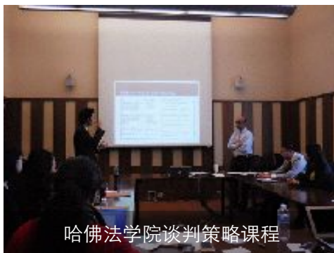
哈佛法学院谈判策略课程