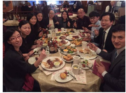
体验美国地道美食