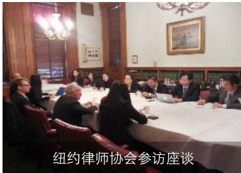
纽约律师协会参访座谈