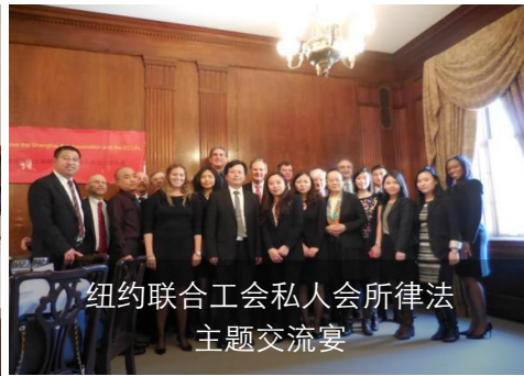
纽约联合工会私人会所律法 主题交流宴