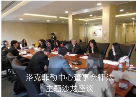
洛克菲勒中心董事会律法 主题沙龙座谈