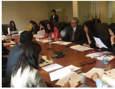
国际知名律所参访