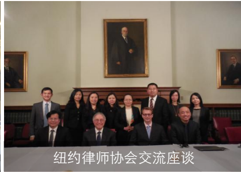
纽约律师协会交流座谈